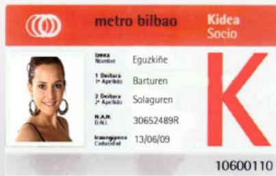
METRO BILBAO Kide Txartela