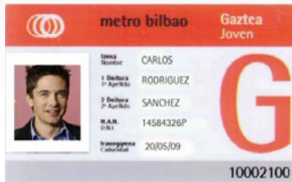
METRO BILBAO Gazte Txartela

Zein txartelek balio du Gazte Txartelekin edo Kide Txartelekin trukatzeko?