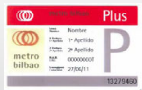
METRO BILBAO Plus Txartela