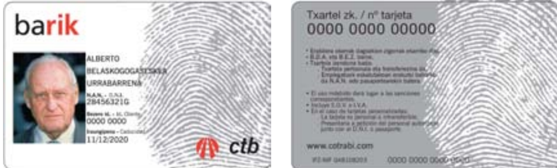
Ilustraciones: Anverso y reverso de la tarjeta BARIK personalizada general.