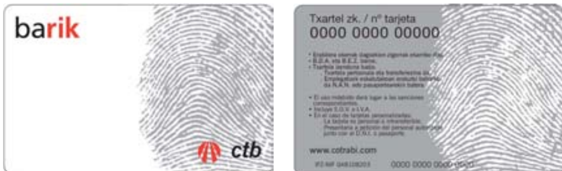
Ilustraciones: Anverso y reverso de la tarjeta BARIK anónima.