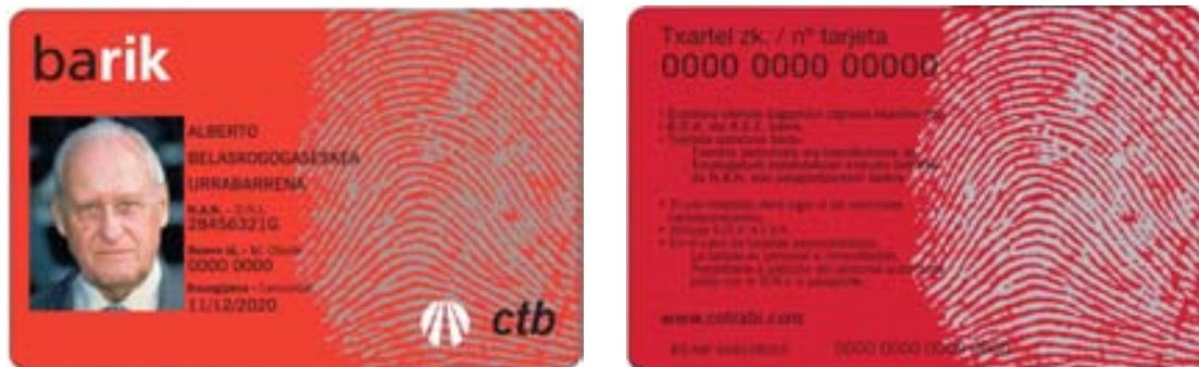
Ilustraciones: Anverso y reverso de la tarjeta BARIK Giza.